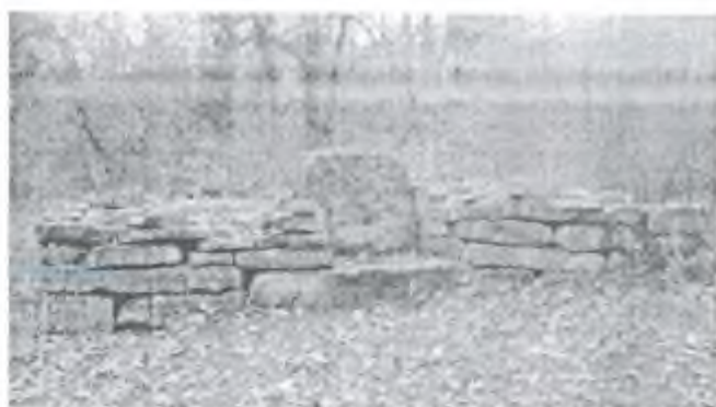
Фото 12. Дольменный комплекс на горе СЕРЕГАЙ