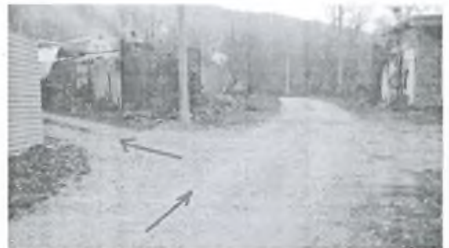
Фото 9. Крутой поворот налево, вверх