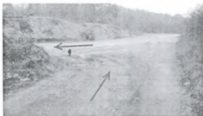
Фото 4. Поворот налево