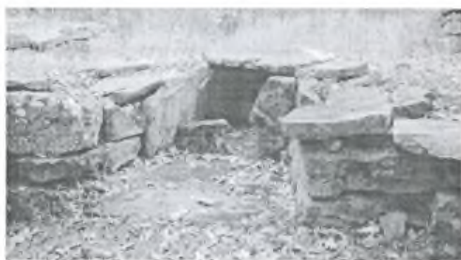
Фото 12- А Дольмены комплекса