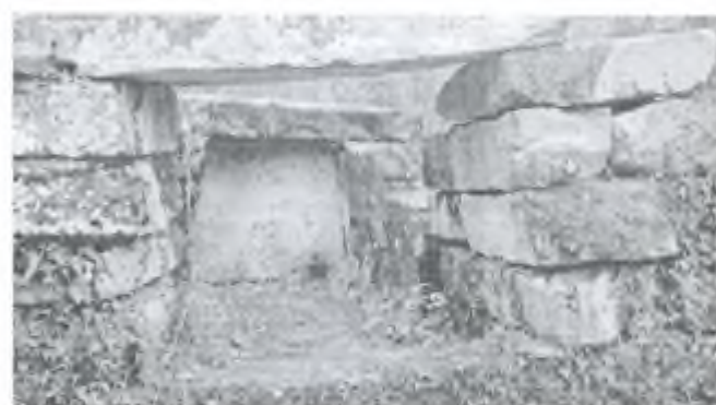
Фото 15 – А. Дольмен