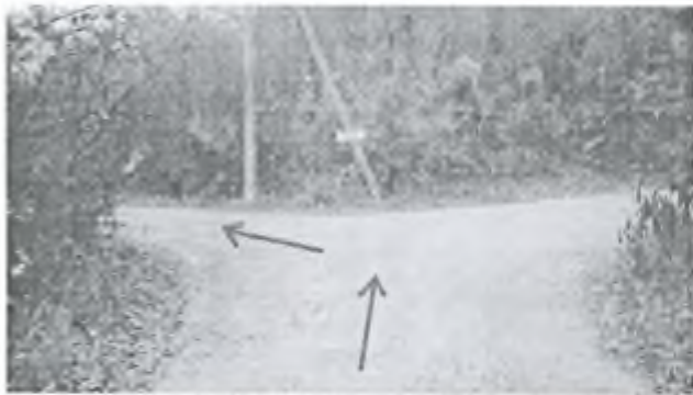
Фото 8. Развилка. Идём влево