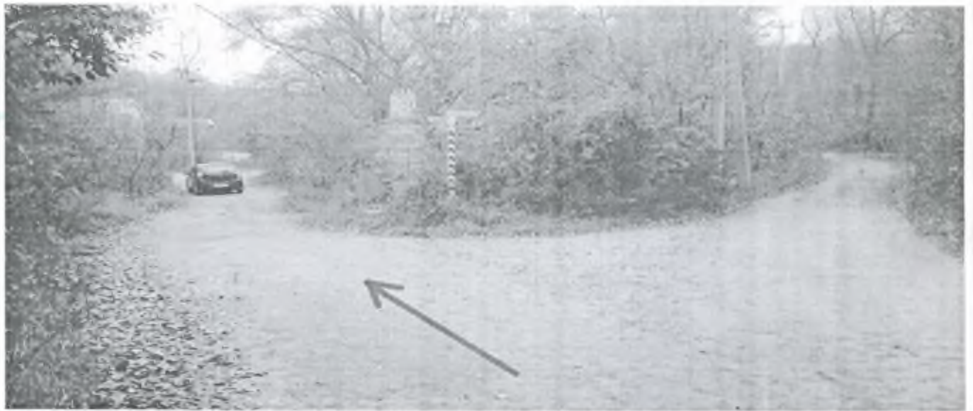
Фото 7. Идём по левой дороге