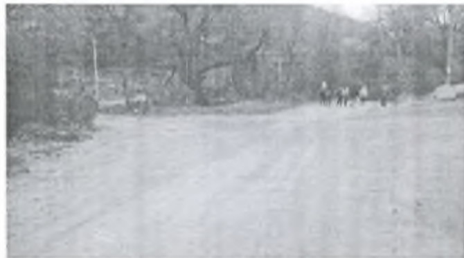
Фото 5. Идём прямо