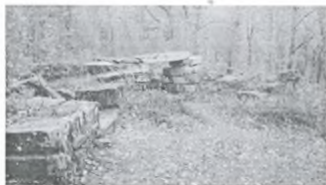
Фото 15. Камни от дольменов у горы Фурова