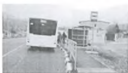
Фото 2. Выходим на остановке посёлок Владимировка