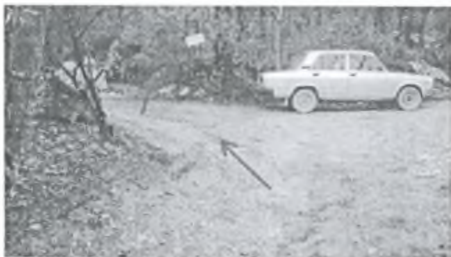
Фото 10. Конец дороге. Начало тропы вверх