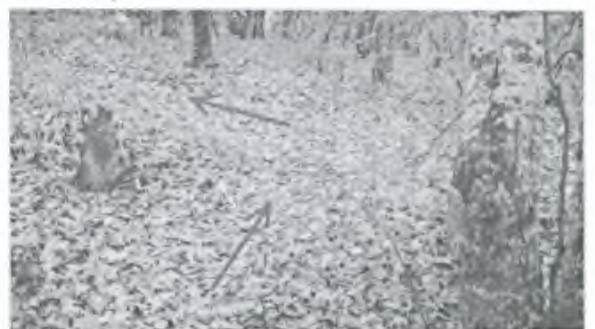
Фото 11. Тропа вывела к лесной дороге. Идём влево