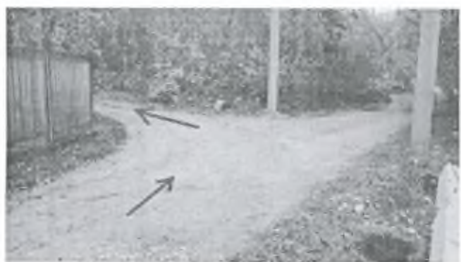
Фото 13. Круто поворачиваем влево