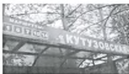
Фото 1. Мы начинаем поход с остановки автобуса 102