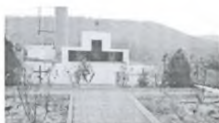
Фото 3. Братская могила