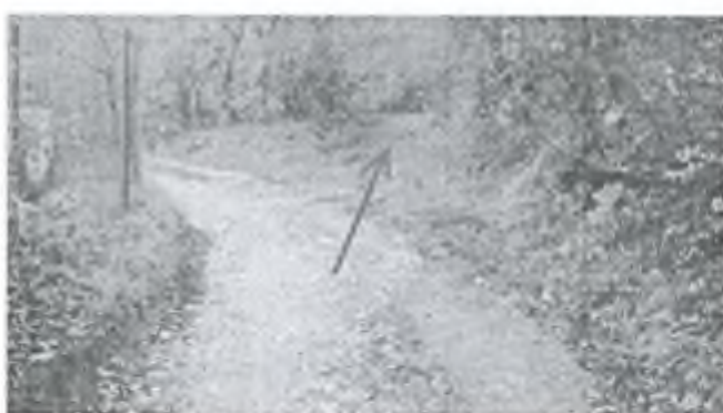
Фото 14. Идём прямо